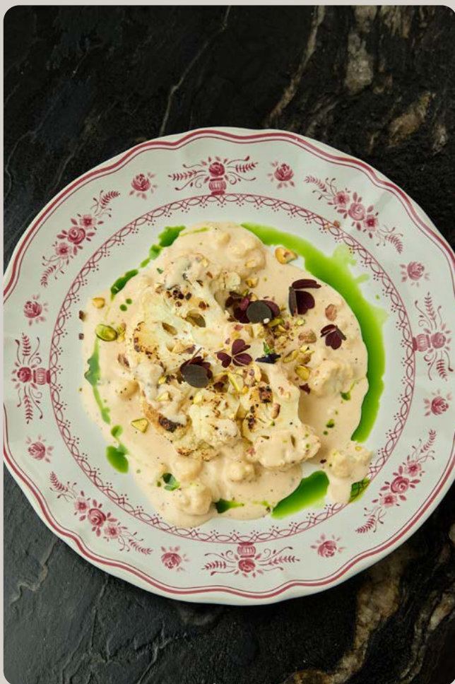
Стейк из цветной капусты со сливочным соусом демиглас