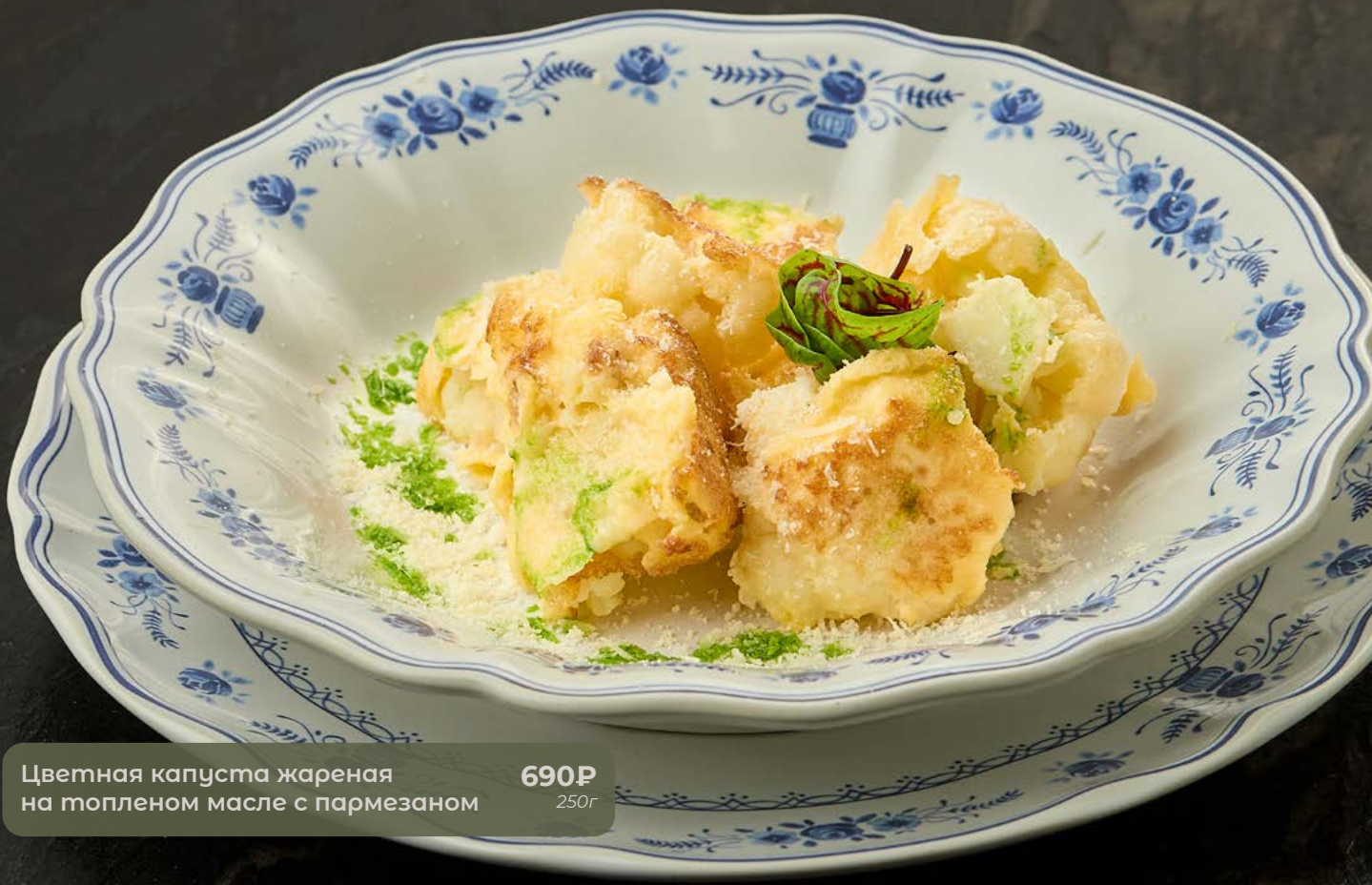
Цветная капуста жареная на топленом масле с пармезаном