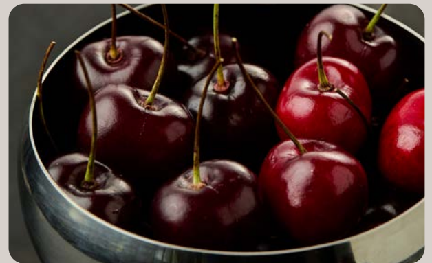
Спелая черешня в креманке