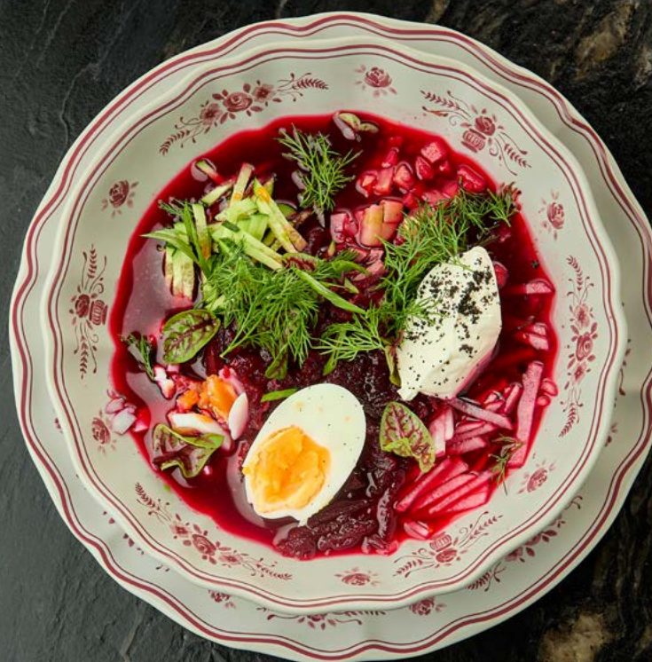
Холодный борщ с печеной бужениной