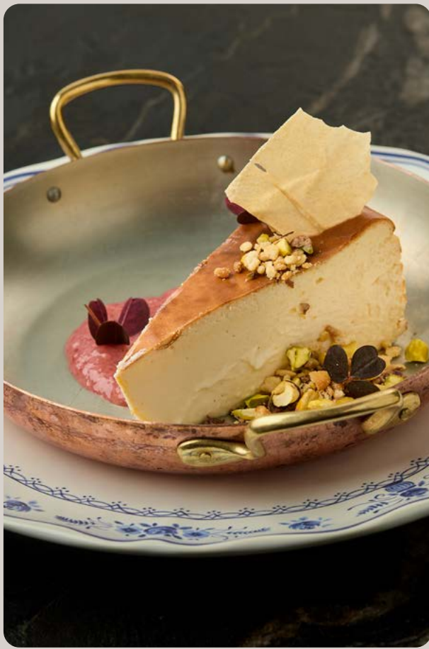
Чизкейк Баскский с клубнично-банановым соусом и карамелью