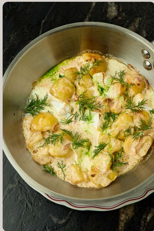
Картофель запеченный с камамбером