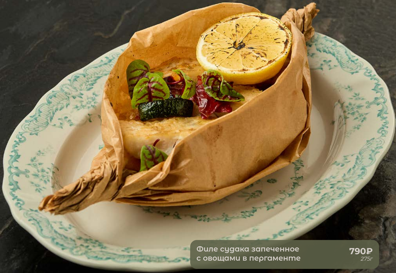
Филе судака запеченное с овощами в пергаменте