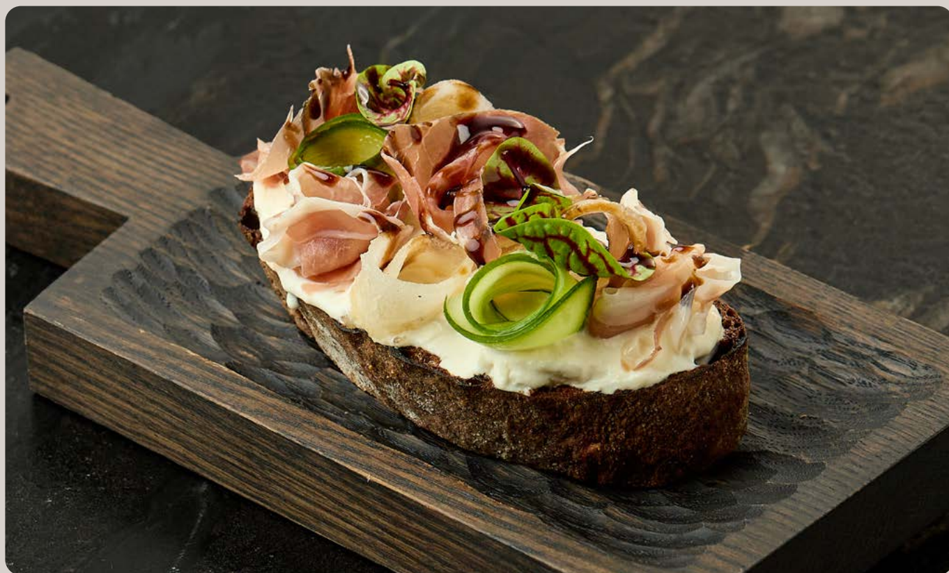
Брускетта с прошутто и страчателлой