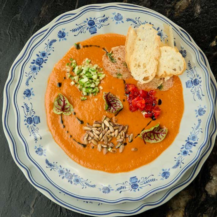
Гаспачо из томатов и печеного перца