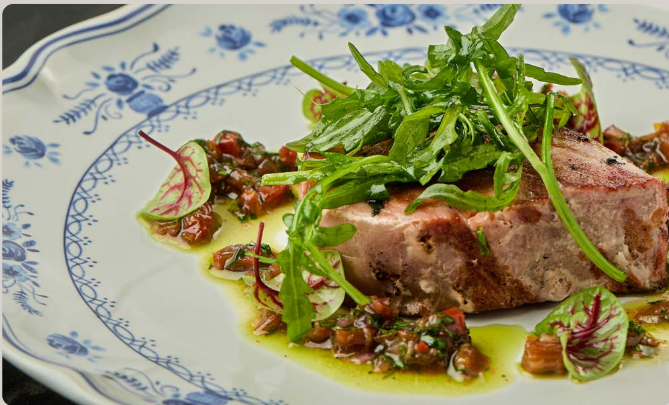
Стейк из тунца