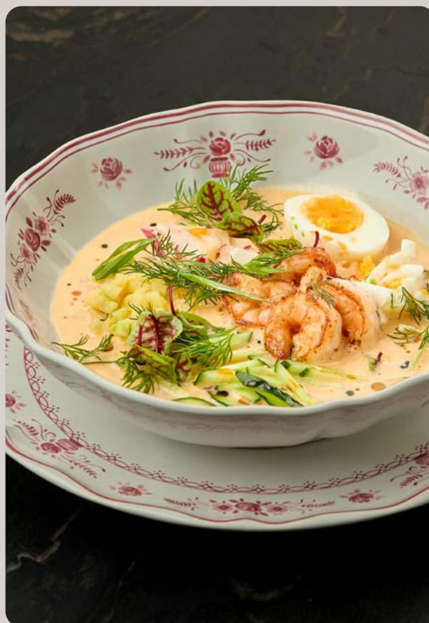
Окрошка том ям с креветками 690P 300г