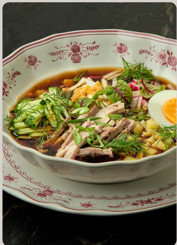
Окрошка классическая с таном или квасом на выбор