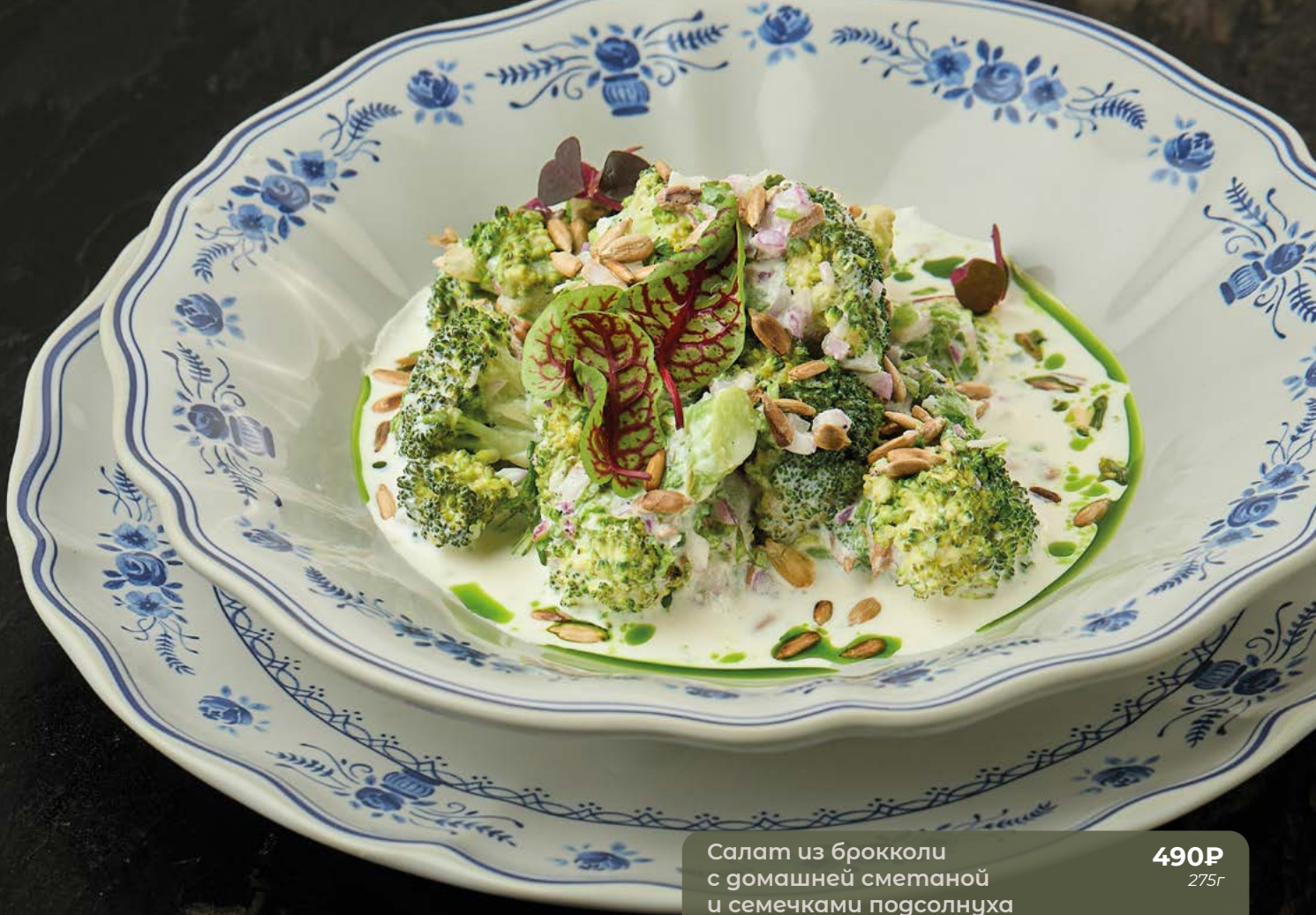
Салат из брокколи с домашней сметаной и семечками подсолнуха